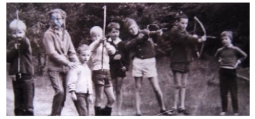
Parkfoto um 1970 von Carola Hädrich

Nordsee Kurpark e.V., Fasanenweg 4, 25938 Wyk