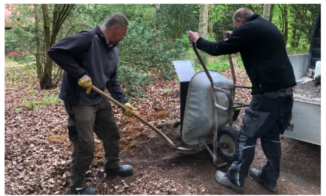
Errichtung einer Info-Stele für den Kurpark-Audioguide