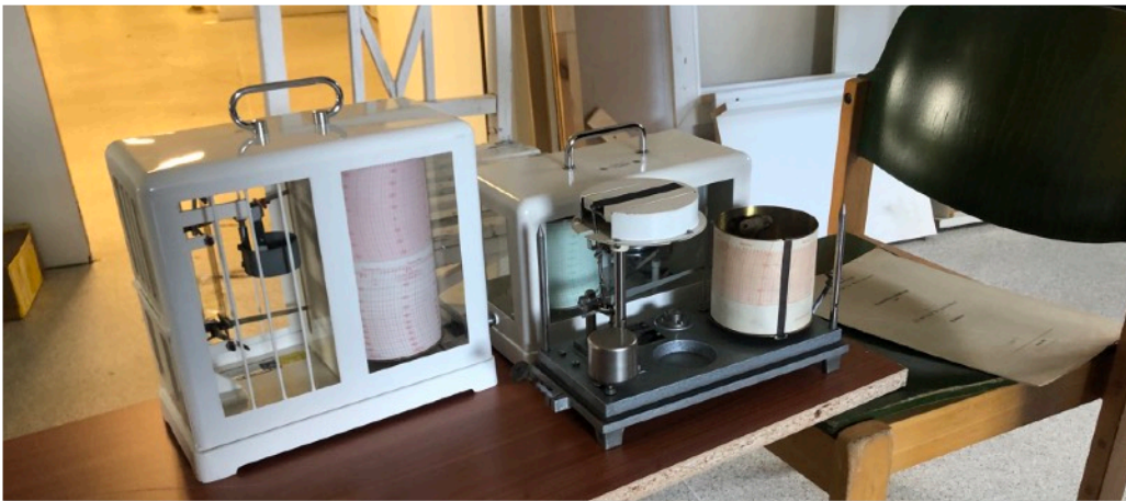
Thermohygrograph und Aneroidbarograph nach Lambrecht (Luftdruckmessungen)