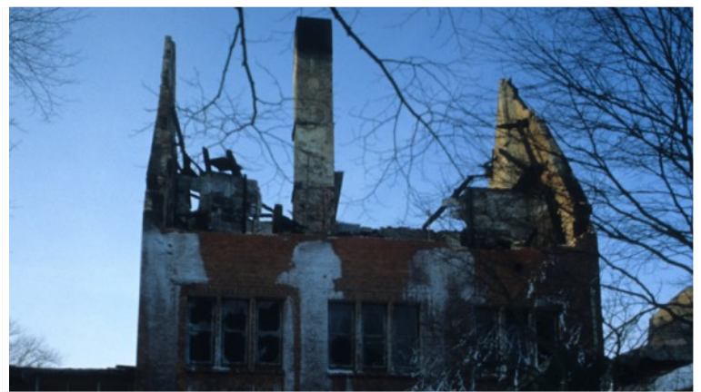
Foto des Sanatoriumsgebäudes nach der Brandstiftung 1985 von Dr. Ziegler