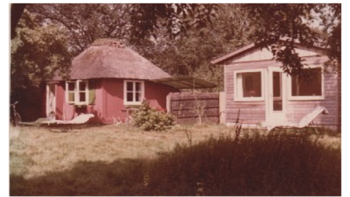
Parkfoto um 1970 von Eberhard Ott