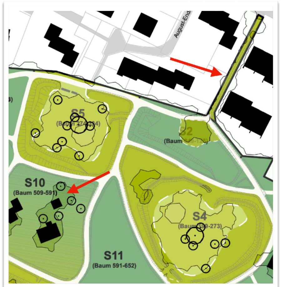
Ausschnitt aus der landschaftsarchitektonischen Studie für den Nordsee-Kurpark

Wie geht es nach der Eröffnung des Kulturzentrums Villa Ludwig, die wir für den Spätsommer diesen Jahres anvisieren, weiter? Für die nächste Phase der Parksanierung haben wir uns die Zuwegung zum Park von der Gmelinstrasse (Bülow-Weg) sowie die Parkgestaltung von Sektor 10 vorgenommen (siehe den Ausschnitt aus der landschaftsarchitektonischen Studie rechts). Zunächst gilt es aber noch eine Vielzahl organisatorischer Themen für den Betrieb des Kulturzentrums zu lösen und das Infomaterial (Flyer) sowie die Website zu aktualisieren. Die Arbeit geht uns also nicht aus - umso wichtiger ist Eure fortgesetzte Unterstützung für unsere Arbeit.