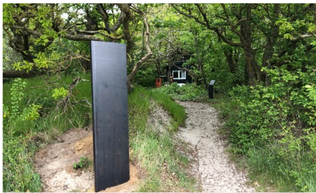
Eines der neuen Parkeingangsschilder

Mitte Mai wurde damit begonnen die Info-Stelen für die vierzehn Kurpark-Audioguide-Stationen sowie die fünf neuen Parkeingangsschilder mit aktualisierter Parkübersichtskarte zu errichten. Die aus hochwertigem Cortenstahl bestehenden Stelen werden nun noch mit Rostbeschleuniger behandelt bevor die Informationselemente montiert werden.