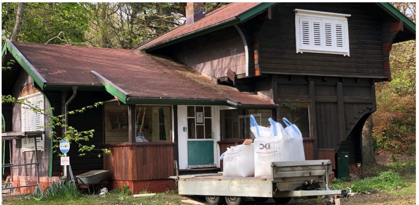
Die Arbeiten an der historischen Villa Ludwig schreiten voran

Die Arbeiten an der Villa Ludwig befinden sich nun in der Endphase. Nach der Installation der Verrohrung für die Elektroleitungen konnten die Böden fertiggestellt werden. Nach Abschluss der verbleibenden Zimmerei- und Elektroarbeiten stehen noch die Malerarbeiten sowie die Installation der Infrarotheizungen und der LED-Lichtsysteme an. Im Juli kann dann mit dem Einbau der Dauerausstellung begonnen werden.