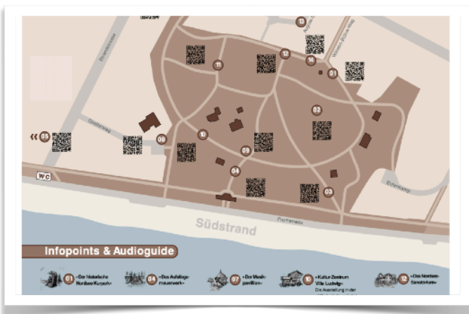
Der neue Flyer mit Lageplan und QR-Codes

Der neue Kurpark-Flyer ist gedruckt und verteilt. Eine wichtige Neuerung ist der Lageplan des Nordsee-Kurparks, in dem alle vierzehn Infostationen unseres Park-Audioguides verzeichnet sind. Über die darauf befindlichen QR-Codes können die Audioguide-Inhalte direkt abgerufen werden.