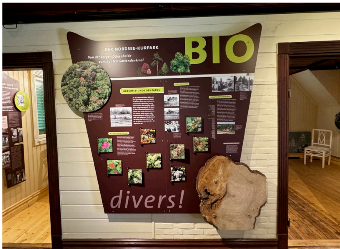
Die Dauerausstellung in der Villa Ludwig